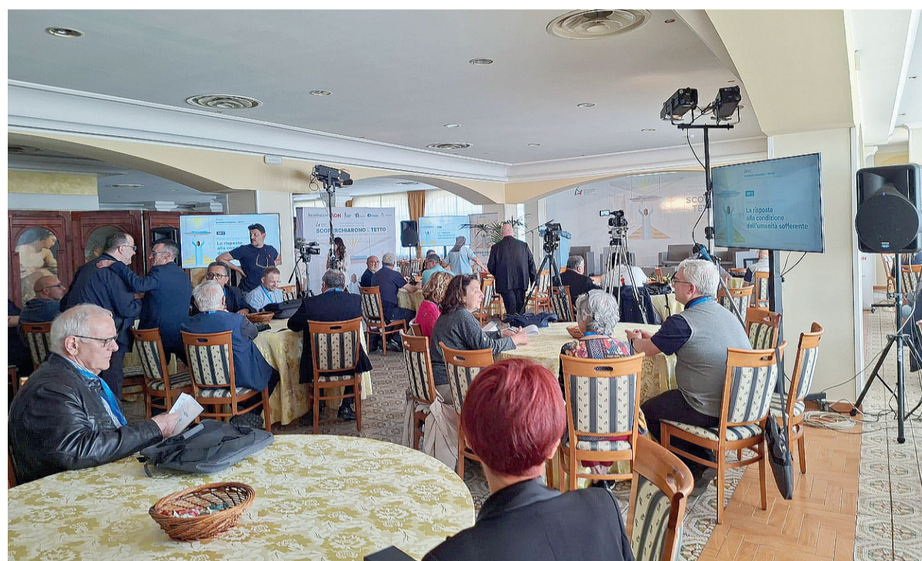
Falerna (Catanzaro): un momento dei lavori del convegno nazionale di pastorale della salute