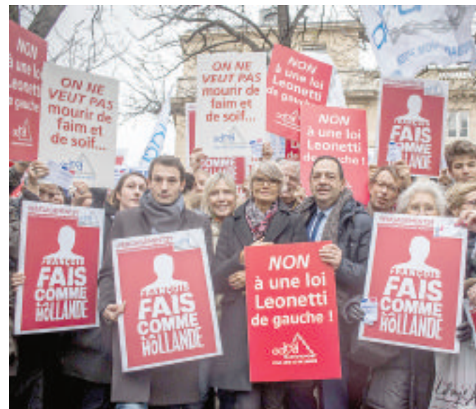
Attivisti in piazza a Parigi a favore dell'eutanasia

autore, tra l'altro, della nuova legge sul fine vita voluta da Hollande e approvata a marzo dall'Assemblée Nationale. Un testo che pur escludendo l'eutanasia prevede una sedazione «profonda, continua» e irreversibile per i malati terminali. Ma il legale dei genitori non demorde. Dopo tutto, benché inappellabile, la sentenza della Corte europea non chiede «in alcun modo» di staccare la spina. Di qui l'appello all'ospedale di Reims a rivedere la decisione di Eric Kariger.