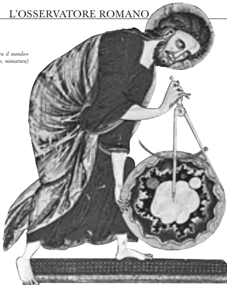
«Cristo misura il mondo» (XIII secolo, miniatura)

In molte chiese costruite dopo la seconda guerra mondiale si osserva una frattura tra iconografia e architettura. La seconda monopolizza l'attenzione.