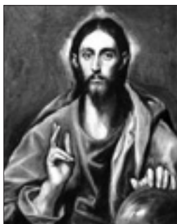
El Greco, «Cristo Salvatore mundi» (1600)

Dal 29 al 31 maggio si terrà nel monastero di Bosc il dodicesimo convegno liturgico internazionale. Organizzato dalla comunità monastica e dall'Ufficio nazionale per i beni culturali ecclesiastici della Conferenza episcopale italiana, l'incontro è intitolato «Liturgia e cosmo. Fondamenti cosmologici dell'architettura liturgica». Lo storico dell'arte François Boespflug ha anticipato al nostro giornale i temi del suo intervento.