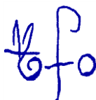
IRCCS Centro S. Giovanni di Dio Fatebenefratelli