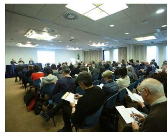
Il Convegno Cei su scuola e Irc