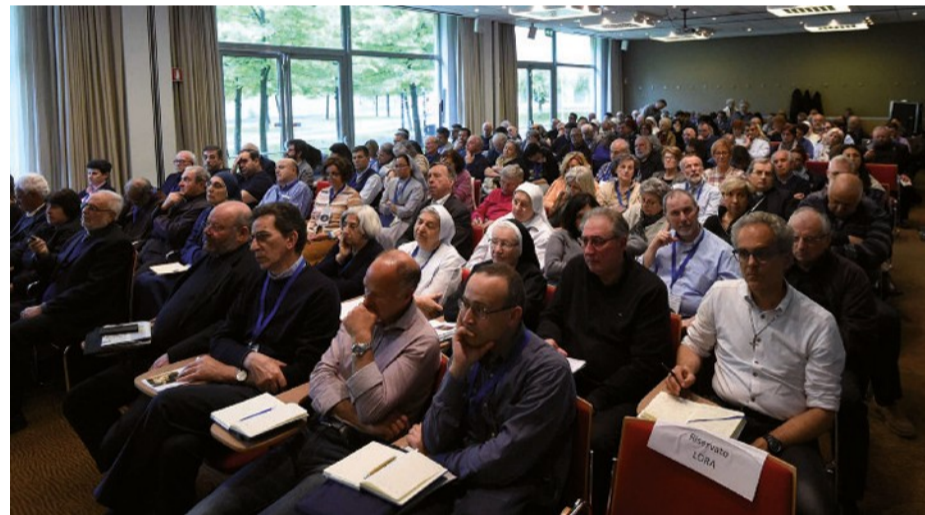
Il Convegno Cei di pastorale sanitaria. A sinistra l'arcivescovo Zuppi